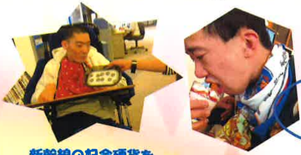
新幹線の記念硬貨を 銀行に交換しに行きました★